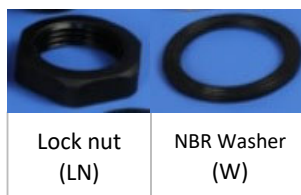
Lock nut (LN)